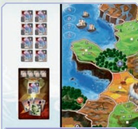
Le Puits aux Âmes et la réserve

est placée dans le Puits aux Âmes au lieu d'être replacée dans la boîte. Les pertes des fantômes doivent toujours être placées sur le dessus de la pile se trouvant dans le Puits. Lorsqu'un déclin provoque la disparition de pions de Peuple, ceux-ci retournent dans la boîte.